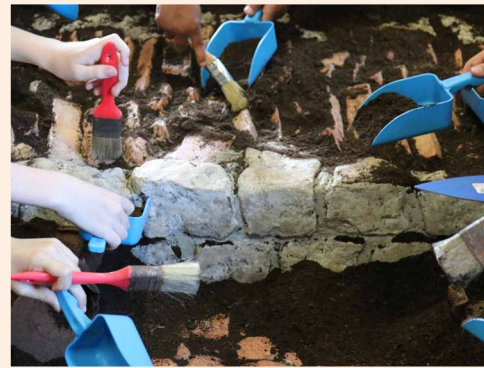
Fouiller comme un archéologue

Remonter un squelette et ses quelques 200 os n'est pas une mince affaire ! Essayez-vous au remontage d'un squelette entier grâce à l'application Profloscope . Atelier du Chronographe, dès 7 ans.